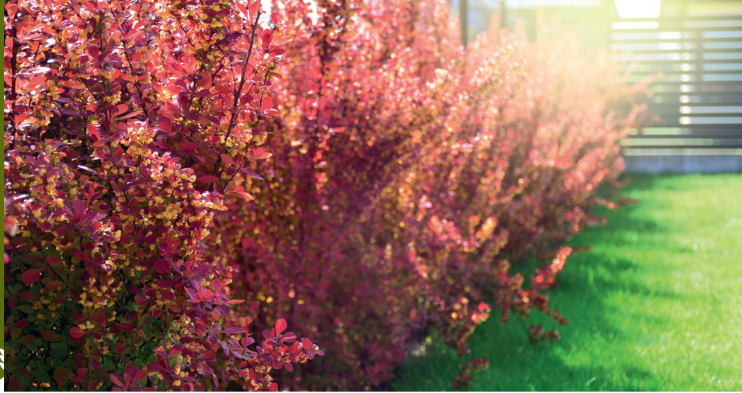
En lækker Berberishäck i höstskrud.